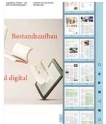
In der Seitenübersicht können Sie direkt zu Ihrem Wunschartikel springen.