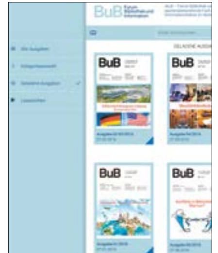
Im Kiosk können die BuB-Ausgaben ausgewählt werden

Sie haben Fragen zur neuen App, möchten Lob oder Kritik loswerden? Unter bubapp@bib-info.de steht Ihnen das BuB-Team gerne zur Verfügung.