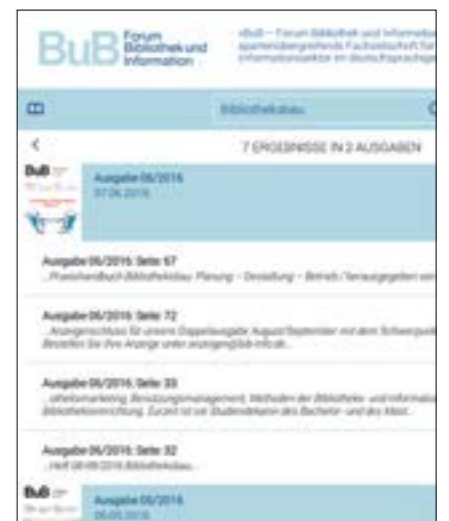
Mittels Suchfunktion kann die App nach Artikeln und Themen durchsucht werden.