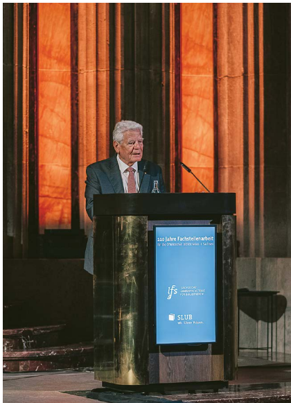
Der ehemalige Bundespräsident hielt in Görlitz ein Plädoyer für Bibliotheken.

Ex-Bundespräsident Gauck würdigt Bibliotheken als demokratiestärkende Orte der Begegnung