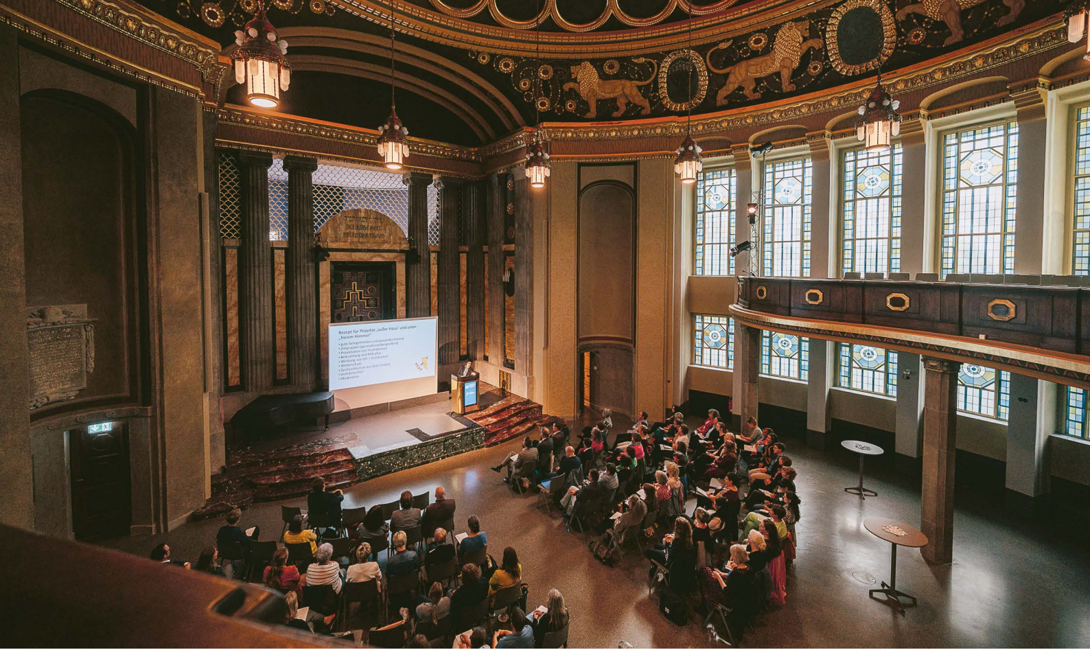
Die Fachstellenkonferenz 2024 fand in geschichtsträchtigen Rahmen statt – im Kulturforum Görlitzer Synagoge.