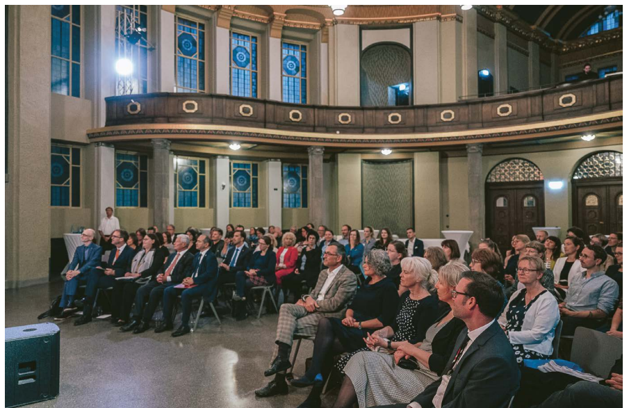
Als erste deutsche Landesfachstelle feierte die Sächsische Landesfachstelle für Bibliotheken in Görlitz ihr 110-jähriges Bestehen. Die Festrede hielt Ex-Bundespräsident Joachim Gauck,

Es gibt vier Öffentliche Bibliotheken, neun Schul- und zwei Hochschulmediotheken sowie das Staatsarchiv und die Parlamentsbibliothek. Nicht nur innerhalb der Gemeinschaft wird